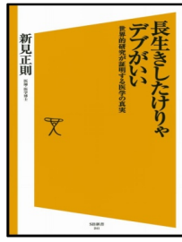
①柴田博先生著 ②帯津良一先生著 ③新見正則先生著