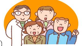
特定健診 の受診を